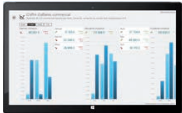
Suivi du chiffre d'affaires sur tablette tactile sous Windows® 8 avec Sage Business Mobile