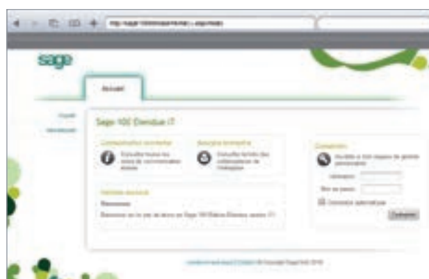
Sage 100 Enterprise Etendue i7 sur iPad®